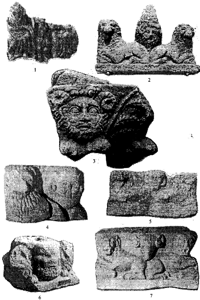
Pl. IV Relief cultural și monumente votive și funerare de piatră: Sucidava – Isis (?), Harpocrate , Serapis (1); Micia: Jupiter Ammon (2); Ulpia Traiana Sarmizegetusa – Jupiter Ammon (3 și 5 ?); Apulum – Jupiter Ammon (4); Napoca – Jupiter Ammon (6); Ampelum – (?).