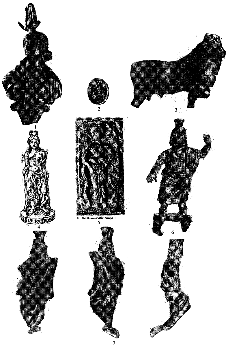
Pl. II Piese de bronz și piatră: Drobeta – Isis (1); Dierna – Apis (2); Romula – Isis și Serapis (3); Băile Herculane (?) – Isis (4); Natania – Personaj cu șerpi (5); Potaissa – Sarapis (6); Romula – Sarapis (7).