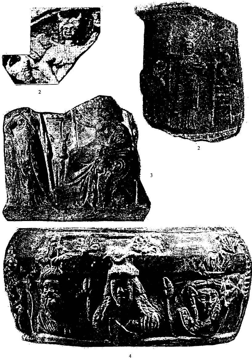
Pl. V 1 – Placa de la Mehadia cu o posibilă reprezentare isiacă; 2 și 3 – Reprezentări care au alături de imaginile Isidei, a lui Sarapis și cea sigură sau posibilă a Boului Apis ( apud LIMC, V 2 , 195 și 194); 4 – Chip mai puțin comun al Isidei ( apud LIMC, V 2 , 197).