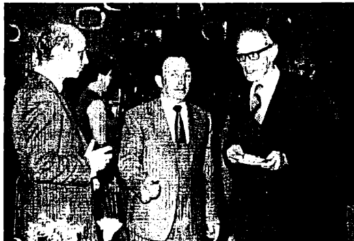
Mircea Petrescu-Dîmbovița la o reuniune științifică la Piatra Neamț.