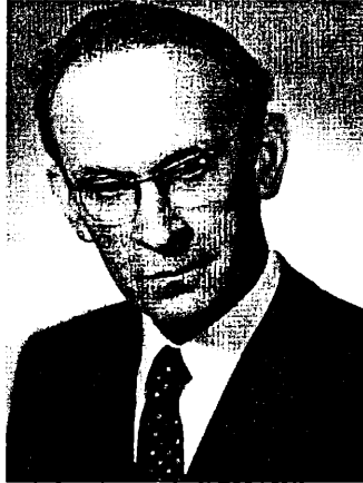
Academicianul Mircea Petrescu-Dîmbovița