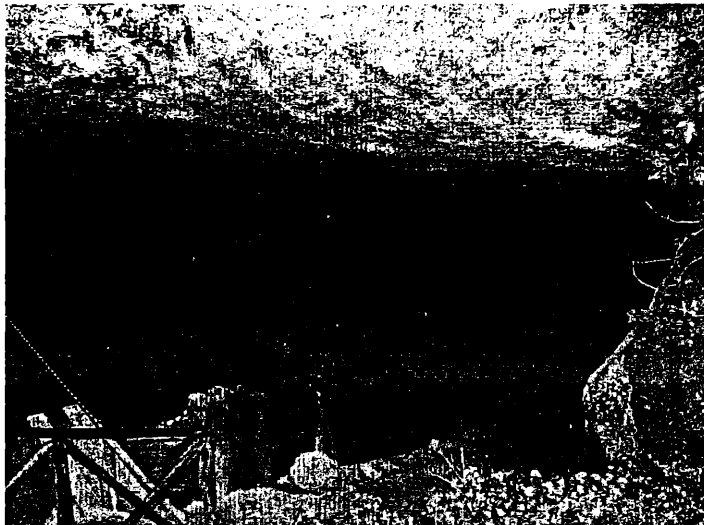
Fig. 2. Peștera Settecannelle.