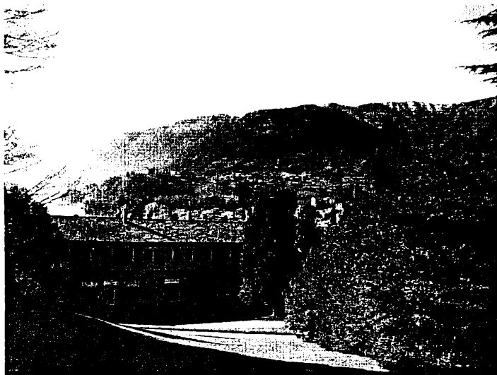
Fig. 1. Bellagio, villa Serbelloni.

Centrul este amplasat în două clădiri principale, Villa Serbelloni (fig. 1) și Maranese, ambele dotate cu tot confortul, la care se adaugă câteva mici studiouri, răspândite în parcul proprietății, în care rezidenții lucrează pe perioada de timp cât sunt la Bellagio. Villa Serbelloni are o sală de conferință de 50 persoane, dotată cu aparatul necesar, iar o altă sală mai mică de conferințe de circa 20 de persoane, se află lângă clădirea principală.