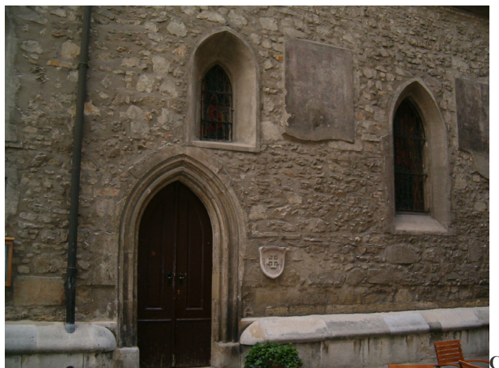
Fig. 1. Imagini din Viena. A – Naturhistorisches Museum; B – Österreichische Nationalbibliothek; C – Ruprechtskirche.