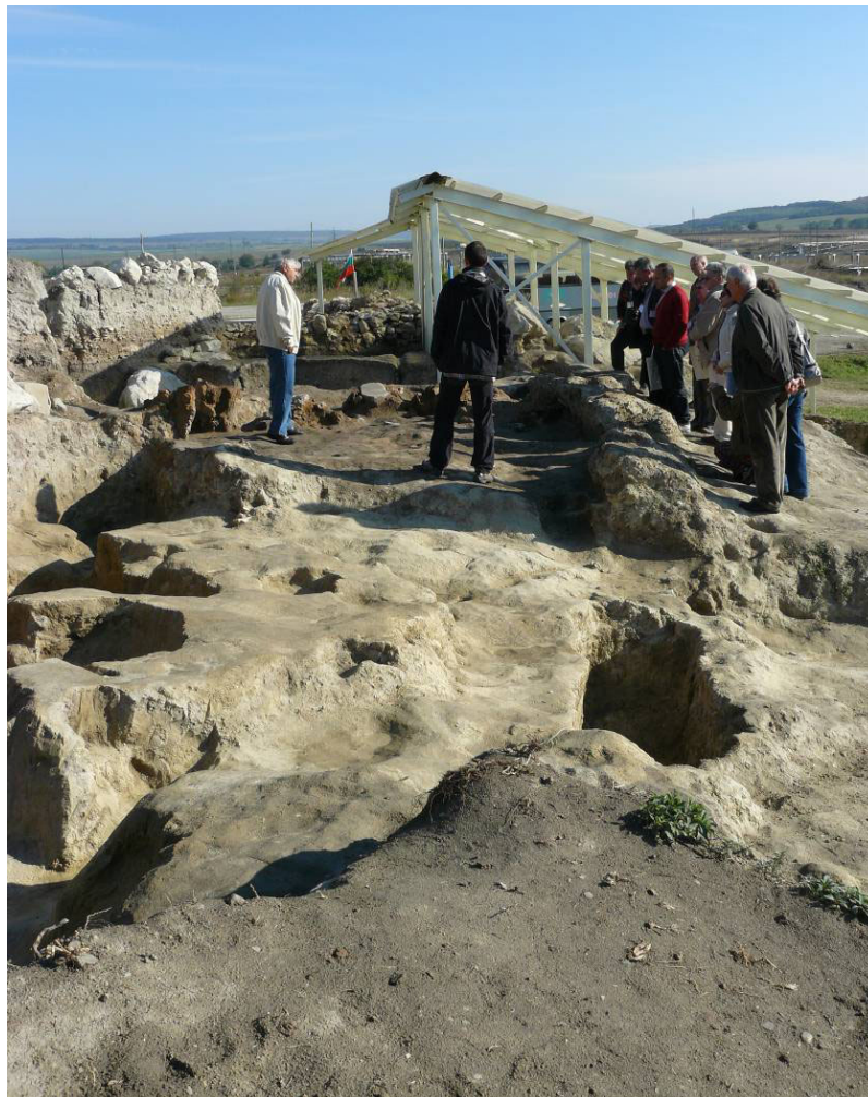
Fig. 3. Provadia. Aspect din săpătura în tell.