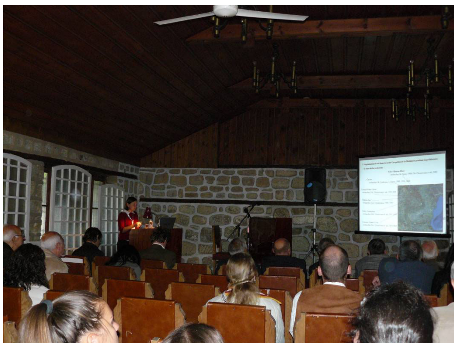
Fig. 1. Provadia. Roxana Munteanu își susține comunicarea.