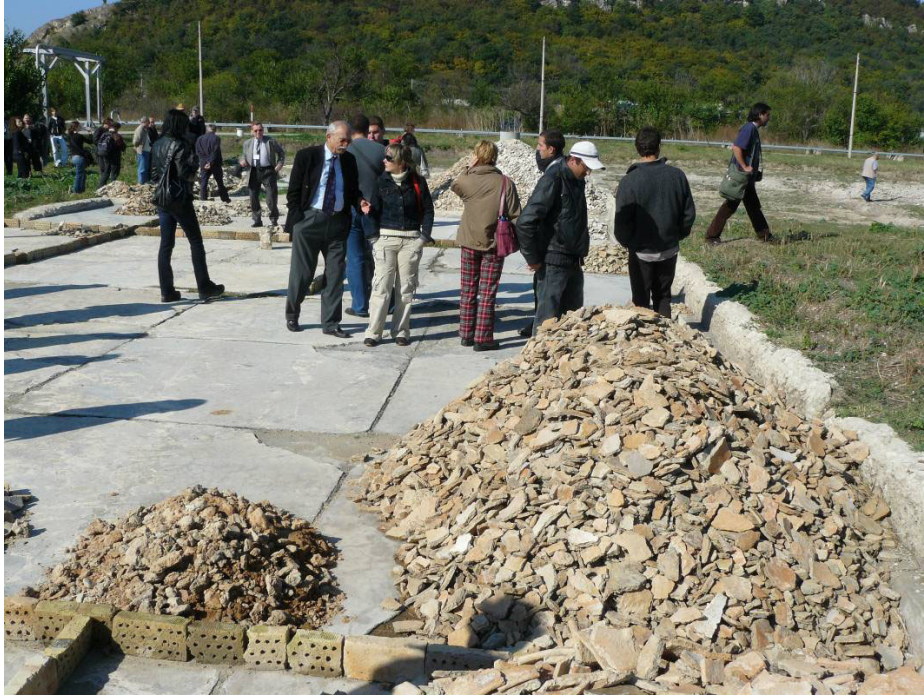
Fig. 2. Provadia. Ceramică în zona de exploatare a sării.