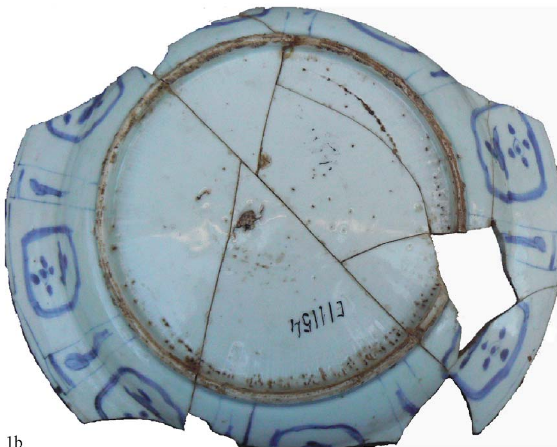
Pl. 1. Porțelan Kraak Wanli (1610–1630), Cetatea de Scaun, Suceava.