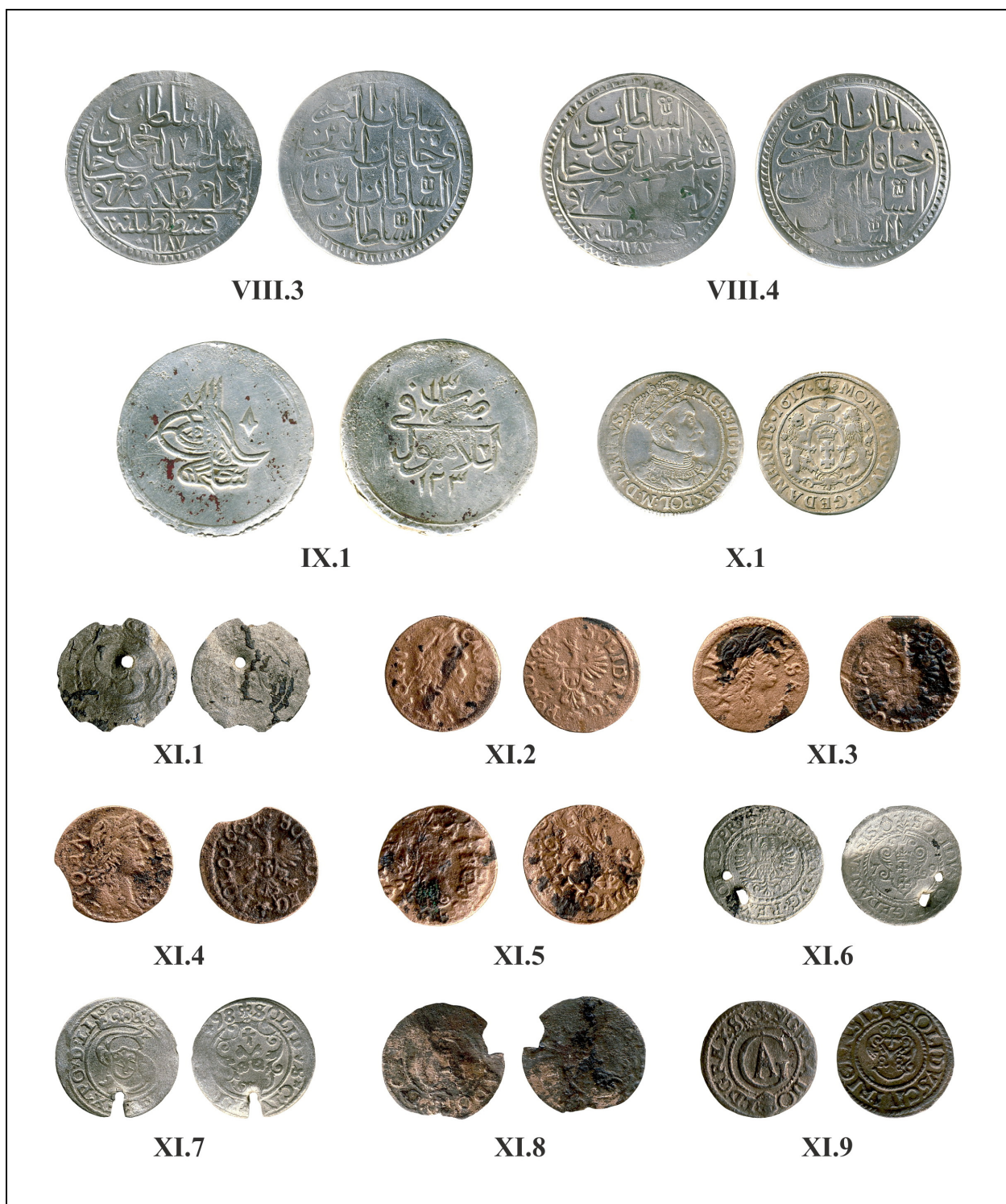
Fig. 2. Monede descoperite în Moldova (nr. VIII.3 – XI.9).