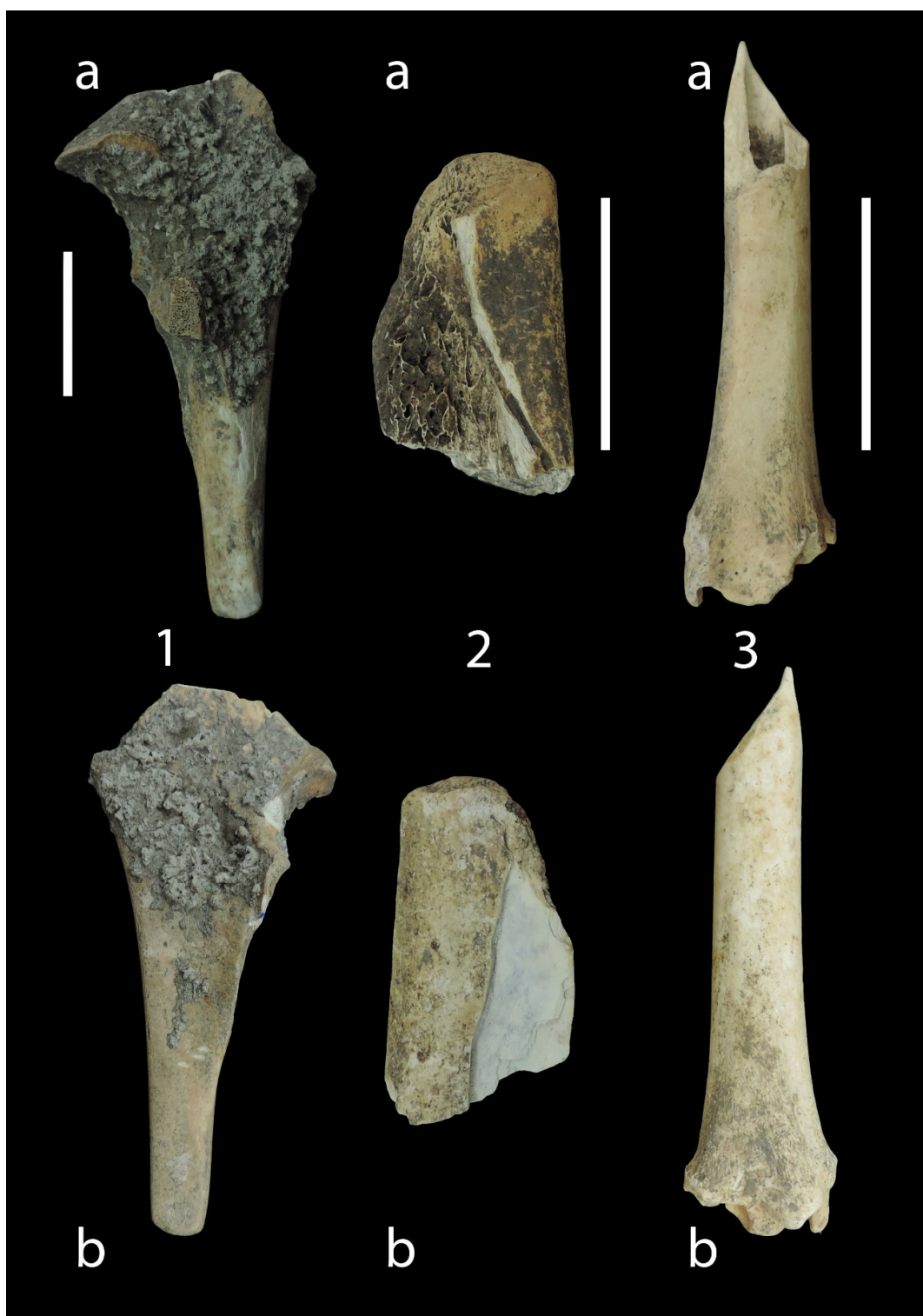
Pl. II. Unelte din os descoperite în situl de la Crețești-La intersecție (oasele sunt așezate în poziție anatomică):