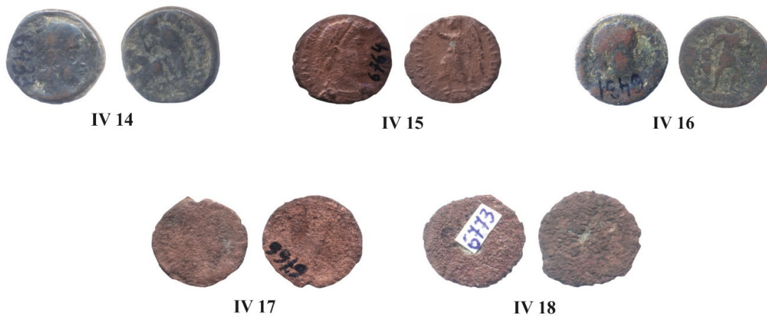
Pl. II. Monede descoperite în Moldova (Cat. nr. IV.14 - 18).