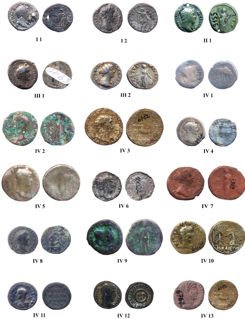
Pl. I. Monede descoperite în Moldova (Cat. nr. I.1 - IV.13).