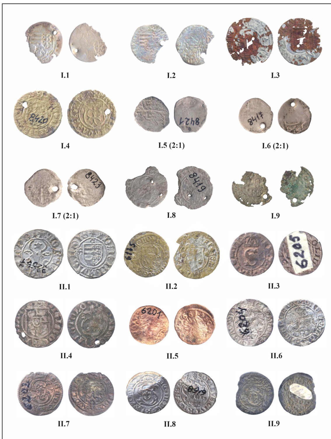
Pl. I. Monede descoperite in Moldova (Cat. nr. I.1-9; II.1-9).