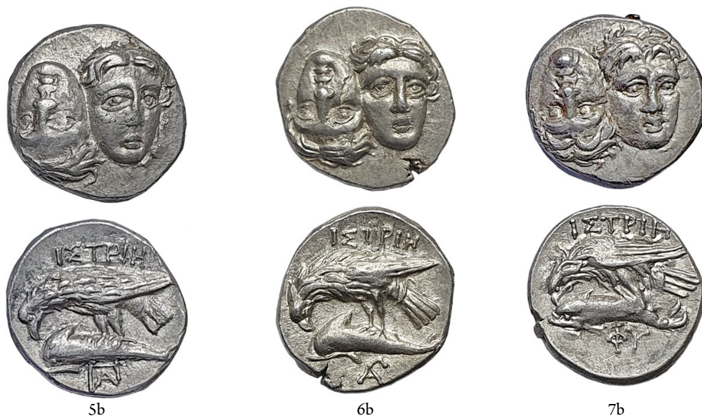
Pl. II. Monedele din tezaurul de la Goruni (1-7a, scara 1:1; 1-7b, scara 2:1).