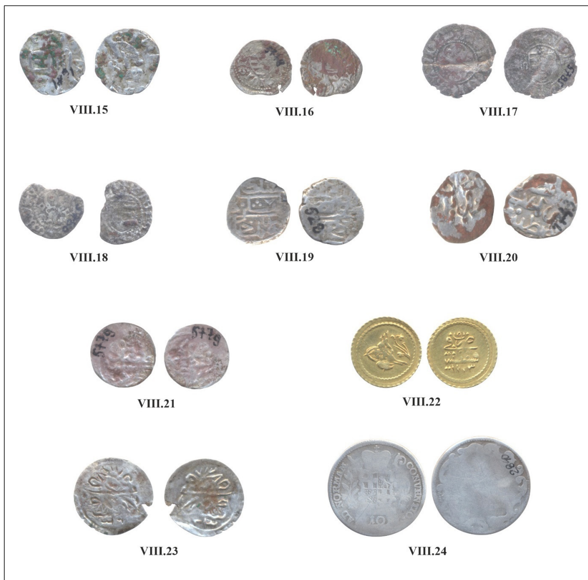
Pl. III. Monede descoperite în Moldova (Cat. nr. VIII.15-24).